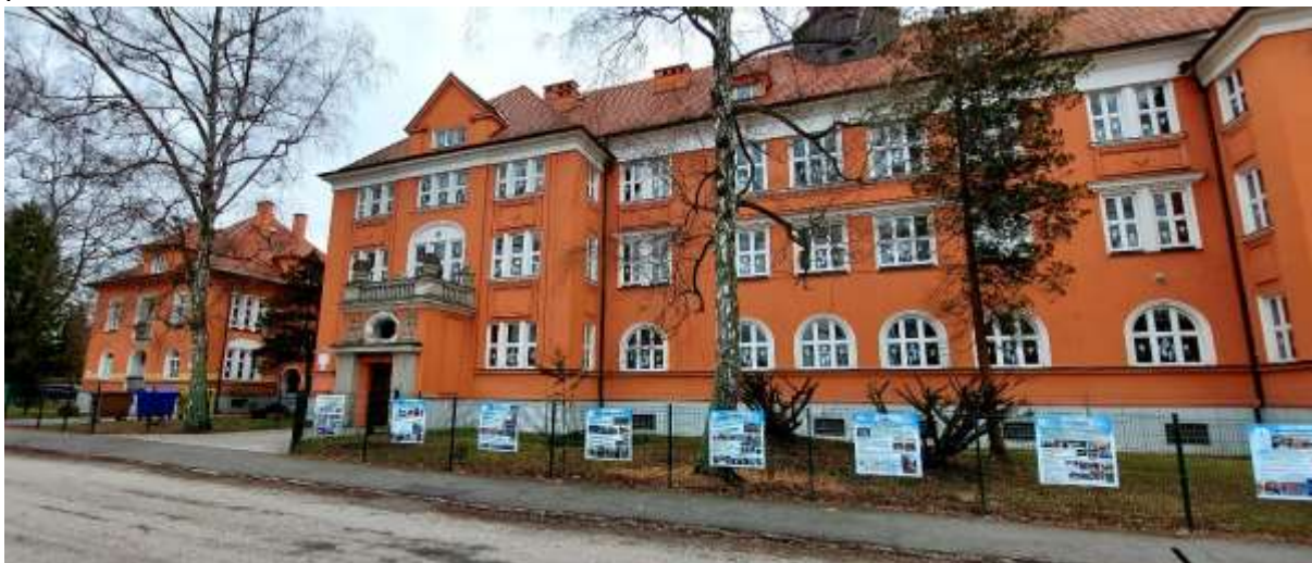
Informační panely na oplocení školy

V rámci oslav 100. výročí otevření budovy školy si škola nechala zhotovit informační panely, které přibližují současnost i historii školy. Panely budou po celý rok umístěny na oplocení pozemku kolem frekventovaného chodníku.