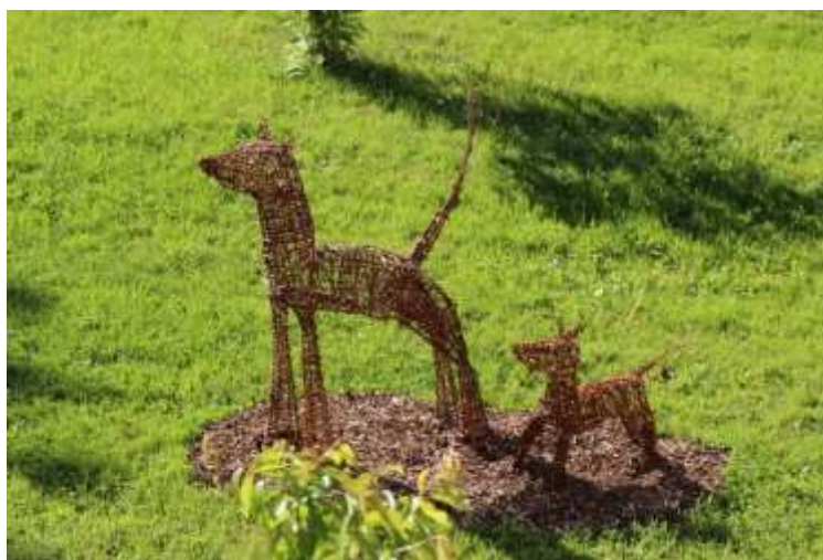
Proutěné sochy ve školní zahradě