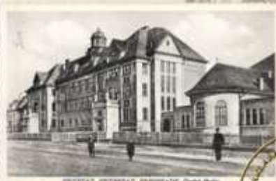
PRVOTNÍ PŘEHLED PŘEDKLADĚ (Ondřej Hejlich)

Střední škola, Základní škola a Mateřská škola, Karviná, příspěvková organizace 1922 - 2022