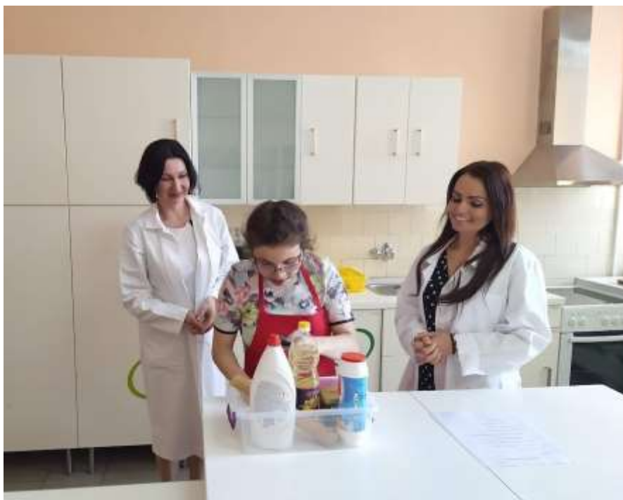
Závěrečná zkouška v Praktické škole jednoleté – praktická část